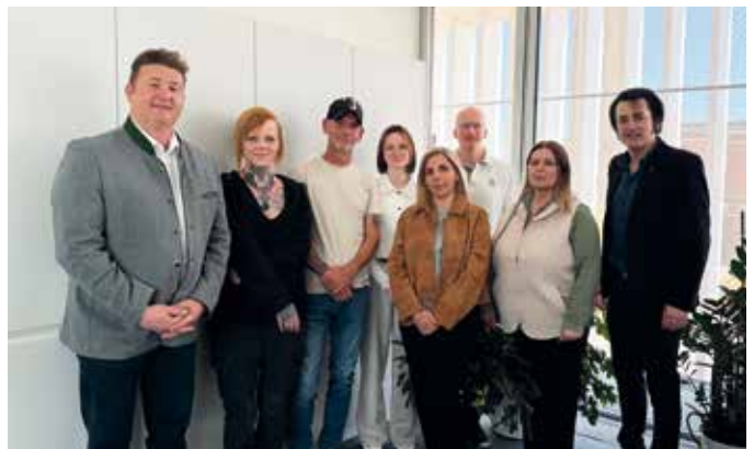
Die neu angelobten Bediensteten