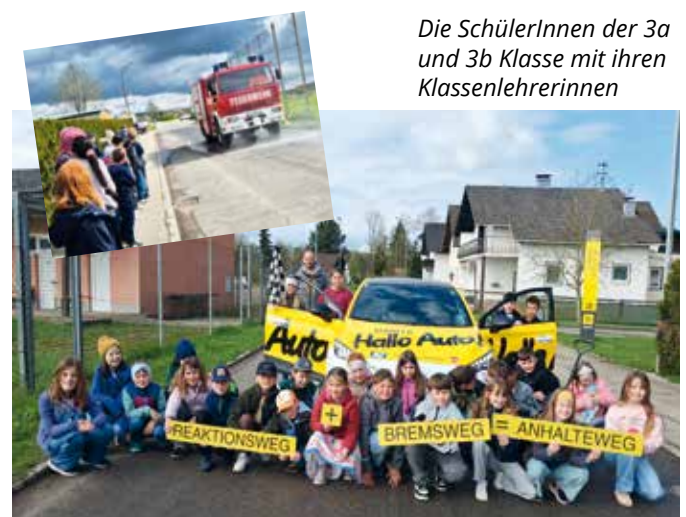
Die SchülerInnen der 3a und 3b Klasse mit ihren Klassenlehrerinnen

Durch diese sehr eindrucksvolle Erfahrung erkennen die Kinder in Zukunft bestimmt die Gefahren heranrender Autos besser und bewegen sich auch im Straßenverkehr viel vorsichtiger. Vielen Dank an die Gemeinde Timelkam für das Sperren und das Bewässern eines Straßenstücks!