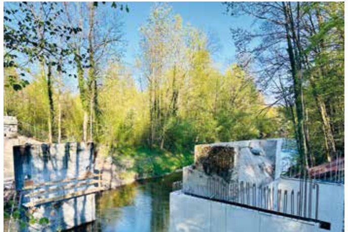
Die Bauarbeiten in Eiding schreiten zügig voran

Dieses wichtige Infrastrukturprojekt wird die Verkehrssicherheit erhöhen und die innerörtliche Verbindung weiter verbessern.