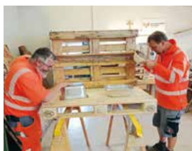
Fleißige Hände waren am Werk