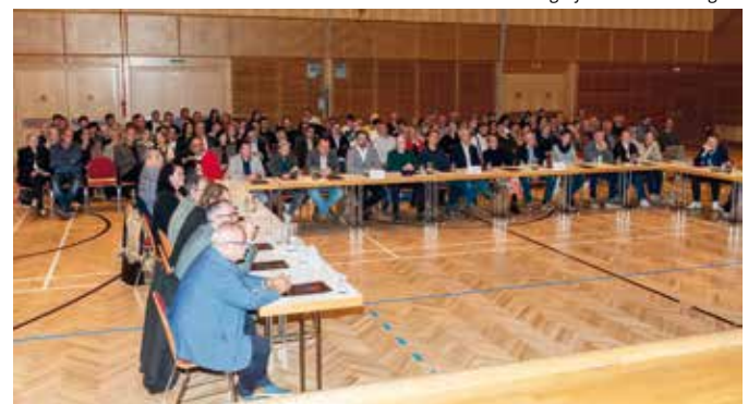
Zahlreiche ZuhörerInnen waren bei der Neuwahl mit dabei