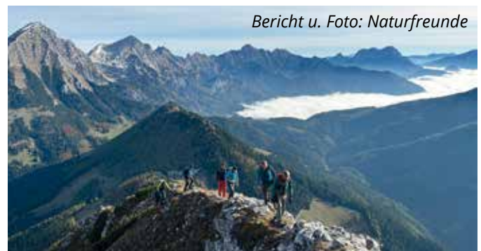
Bericht u. Foto: Naturfreunde

Entlang des eindrucksvollen Grats erklimmen die Naturfreunde gleich drei Gipfel – die Frauenmauer, den Bosruck und den Kitzstein. Der herrliche Ausblick auf das Ennstal und die umliegenden