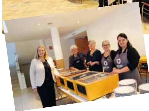
Das engagierte Team der Gemeindevertretung bewirteten die zahlreich erschienenen BesucherInnen.