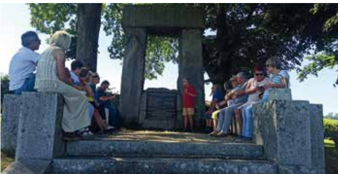
Beim Denkmal am Haushamerfeld

Das beeindruckende Spiel über die grausame Bestrafung von angeblichen Rebellen konnte bei Vollmond erlebt werden.