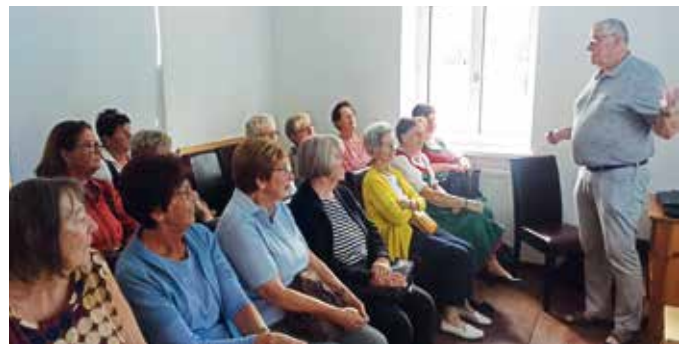
Die Goldhaubengruppe beim Einführungs Vortrag