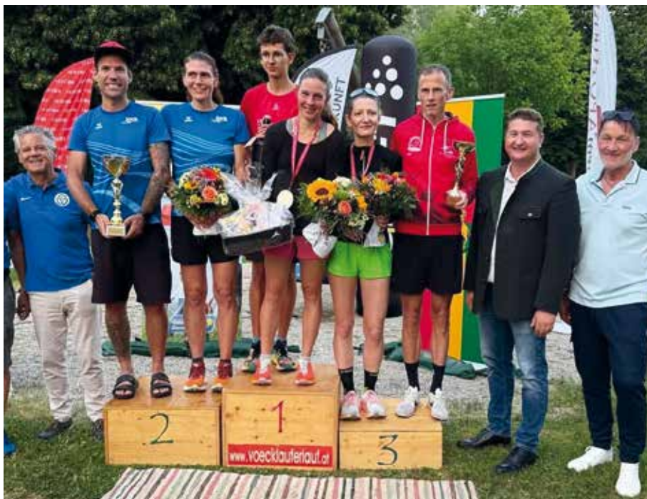
Die Tagesschnellsten Damen und Herren