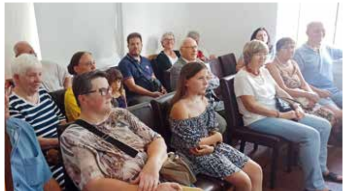
Aufmerksame Zuhörer bei der kurzen Einführung