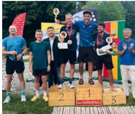
Die schnellsten Timelkamer