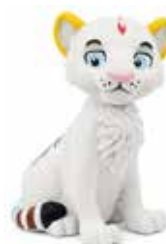
Billie, der Regenbogentiger

Die Schlümpfe – Ein unwiderschlumpliches Lächeln Dino-Ranch Kleine Experten tauchen mit Walen Kleine Experten begleiten Elefanten Aladin Peppa-Pig – Meine Geburtstagsparty Leo's Tag „Windel, Töpfchen, Klo – das geht so!“